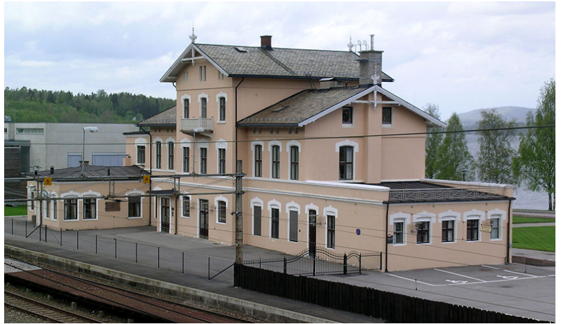
Eidsvoll stasjon i nyoppusset versjon.

I 1854 ble den første jernbanen i Norge åpnet. Den gikk fra Christiania til Eidsvoll. Grunnen til at Eidsvoll ble valgt som endeholdeplass for den første jernbanestrekningen, var beliggenheten nær vannvegen til Hedmark og Oppland, og videre til Trondheim. Alt før jernbanen kom, var det hyppig frakt av varer på Vormå og Mjøsa. Etablering av jernbanen i kombinasjon med dampbåt på Mjøsa og Losnavannet, ga et effektivt kommunikasjonssystem mellom hovedstaden og Ringebu.