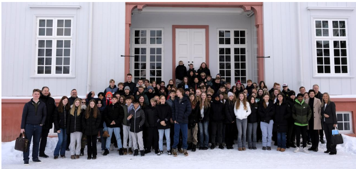
Stor oppslutning under årets Demokratiscampfinale (Innovasjonscamp) på Eidsvoll.