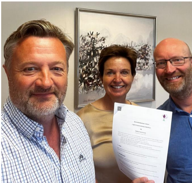
På Eidsvoll vgs. hadde 24 elever ungdomsbedrift.

46 elever har hatt elevbedrift på sin ungdomsskole. Dette er en økning fra i fjor og dekningsgraden er nå på 12,6%. Elevbedrift passer svært godt i flere fag og dekker mange av læreplanmålene og ikke minst de tverrfaglige temaene. 10. trinn på Feiring og Vilberg har også hatt Økonomi og karrierevalg med Totens Sparebank. I tillegg har alle ungdomsskolene deltatt på Innovasjonscamp med Eidsvoll 1814 som oppdragsgiver.