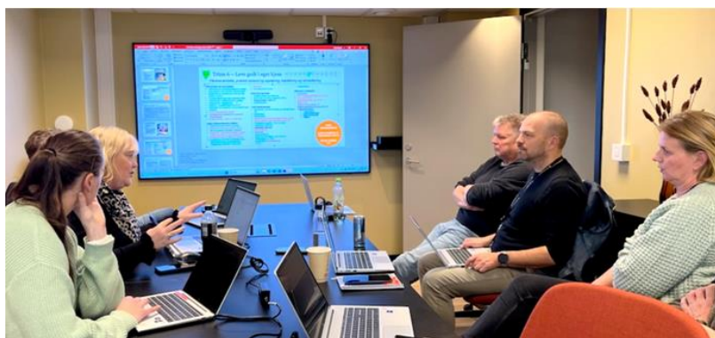
Ressursgruppa i arbeid

Innsatstrappa har vært tema for flere utviklingssamlinger i kommunen høsten 2024. Den 6. november samles flere ledere, ansatte og innbyggere til en ny samling. Da er tema hvordan Eidsvoll i enda større grad skal lykkes med å satse på tidlig innsats og forebyggende tjenester.