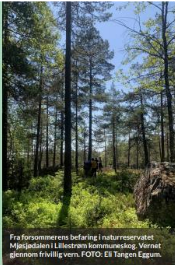
Fra forsommerens befaring i naturreservatet Mjøsødalen i Lillestrøm kommuneskog. Vernet gjennom frivillig vern.

Arrangør: SKOGREGION 4 ved følgende 20 kommuner: Aurskog-Høland, Lillestrøm, Eidsvoll, Hurdal, Nittedal, Lørenskog, Nannestad, Nes, Jevnaker, Lunner, Rælingen, Ullensaker, Gjerdrum, Oslo, Enebakk, As, Nesodden, Nordre Follo, Frogn og Vestby.