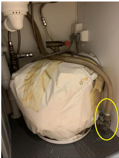
Bilde av benkebereder med sikkerhetsventil

Ved mistanke om lekkasje på sikkerhetsventilen ta kontakt med en rørlegger.