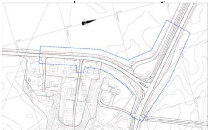
Figur 3 Kartutsnitt viser varslet planavgrensning, datert 27.06.2023.

Kart over varslet planområde vises i Figur 3.