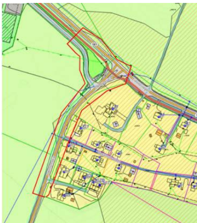
Figur 1 Planområdet.